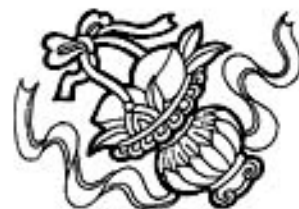
Маленький инструмент Лань Цайхе - Корзина с цветами

Изображают Ланя, одетым в один сапог, за спиной у него корзина с хризантемами, цветами и бамбуком. Летом он ходит в шерстяной рубашке, зимой спит на снегу.