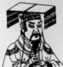
Юй ди (Нефритовый император)

Если более конкретно определить его значение, то он отвечает за три мира — Небо, Земля, Человек, десять направлений (восемь сторон света, задир, надир), четыре процесса создания ( si sheng ) и шесть путей (шесть изменений природного цикла). Также он является одним из пяти мифологических императоров ( wu yu ) (Фуси ( Fuxi ), Шэньгун ( Shennong ), Шунь ( Shun ), Яо ( Yao ), Юйди ( Yudi ), по другой версии Чжуаньди ( Zhuandi ) вместо Фуси), которые подчинены Трем Чистым (трем покровителям сфер внешнего мира) и символизируют четыре стороны света и центр, а также пять стихий.