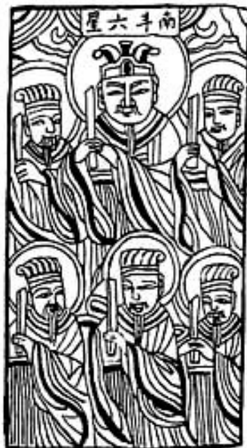
(а) Шесть звезд Малого Ковша (Nandouliuxing) — Тяньфу (Tianfu), Тяньсян (Tianxiang), Тяньлянь (Tianliang), Тяньтун (Tiantong), Тяньшуй (Tianshui), Тяньцзи (Tianji).

Далее на северной стене изображены шесть звезд Малого ковша, находящиеся в южном секторе неба, и семь звезд Большого Ковша, находящиеся в северном секторе неба — тринадцать основных звезд, которые символизируют законы макрокосмического построения.