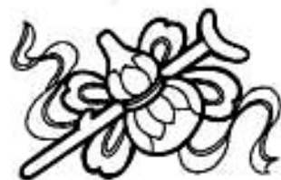
Магический инструмент Ли Тегуай - Тыква-горляника

Его представляют в образе скитальца, бездомного одноногого попрошайки с черным лицом, круглыми глазами, курчавой бородой и волосами, схваченными золотым обручем, который однажды дал ему монах, обучавший его. В руках у него железный посох, который он использует для движения.