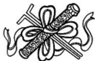
Магический инструмент Чжан Голао - бамбуковые дощечки Ю-гу

В мире толпы людей... Но кто может сравниться со стариком Чжаном, Смотрящим в будущее, Сидя задом наперед на ослике?