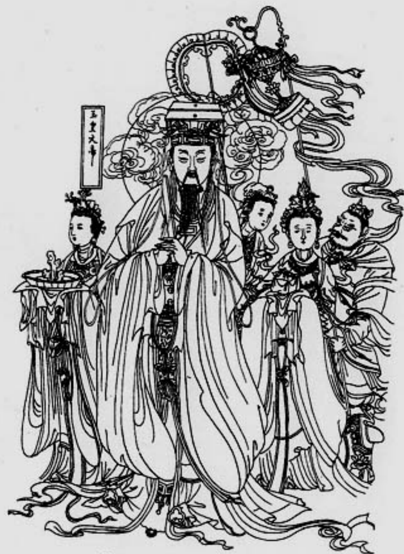
Нефритовый император со свитой

Юй Хуанди обычно изображают с короной ( jiuzhang fafu ) на голове, сидящим на троне. В руках он держит нефритовую пластину. День рождения Нефритового императора — девятый день первого лунного месяца (минимальное количество дней, в течение которых происходит циклическое превращение). Он носит бороду и усы и живет на горе Куньлунь ( Kunlun ), откуда управляет всеми делами.