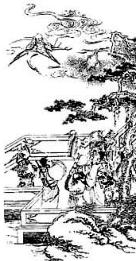
Встреча восьми бессмертных с Ляо-цзы

Группу восьми бессмертных в китайской традиции образуют Люй Дунбинь ( Lu Dongbin ), Ли Тегуай ( Li Tieguai ), Хань Чжунли ( Han Zhongli ), Цао Гоцзю ( Cao Goujin ), Хань Сянцзы ( Han Xiangzi ), Лань Цайхэ ( Lan Caihe ), Чжан Голао ( Zhang Goulaao ) и Хэ Сянгу ( He Xiangu ).