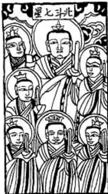
(б) Семь звезд Большого Ковша (Beidouqixing) — Тяньчун (Tianchun), Тяньсюань (Tianxuan), Тяньцзи (Tianji), Тяньроань (Tianruan), Тяньхэ (Tianhe), Тяньхэ (Tianhe), Кайянь (Kaiyuan), Яогун (Yao-guan).

Далее располагаются пять планет — Венера (Jinying), Юпитер (Muxing), Меркурий (Shuixing), Сатурн (Tuxing), Марс (Huoxing). Также здесь представлены Бог Солнца (Taiyangshen), Бог Луны (Yueliangshan) и двадцать восемь созвездий.