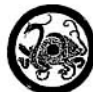
Четыре животных, характеризующих направления Зеленый дракон (восток), Белый Тигр (запад), Красный Феникс (юг), Черная Черепаха (север)