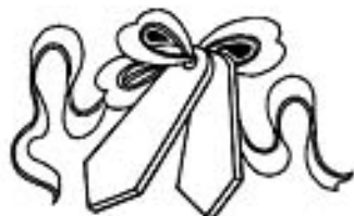
Магический инструмент Цао Гоцзю - Нефритовые трещотки

Традиционно Цао Гоцзю изображается в красной форме и головном уборе чиновника высокого ранга, с трещотками в руках.