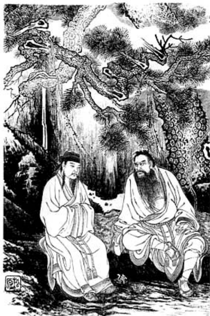
Люй Дунбинь проходит обучение у Хань Чжунан

обучать его различным техникам тела, используя при этом принцип фехтования.