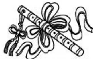
Магический инструмент Хань Сянцзы - Флейта

Хань Сянцзы прославился тем, что умел делать вино из воды и выращивать зимой цветы. Его обычно изображают красивым юношей, который играет на флейте. За эту красоту Хань Сянцзы иногда даже ассоциировался с женщиной, и на изображениях ему придавались женские черты.