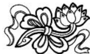
Магический инструмент Хэ Сангу - Цветок лотоса

В городе Гуаньчжоу, где она родилась, расположен посвященный ей храм. В седьмой день третьего лунного месяца почитатели Хэ возносят ей почести. Бессмертная Хэ является символом чистоты и традиционно считается покровительницей домашнего очага.