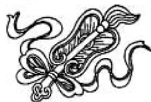
Магический инструмент Чжунли Цюань - Веер

Чжунли Цюань изображается мужчиной большого роста, с курчавыми, перепутанными волосами, собранными в пучок, с горящими глазами и бородой, как у дракона. Все его тело татуировано. На людях он появляется с обнаженным животом и босыми ногами. Чаще всего его изображают с веером, который является символом отпугивания нечистых сил и оживления мертвых. Являясь главным среди восьми бессмертных, он отвечает за составление списка всех бессмертных и утверждение всех писаний и трактатов, связанных с циркуляцией ци .