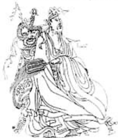
Люй Дунбинь с магическими предметами — мухобойкой, отпугивающей нечисть, и мечом, поражающим людские пороки и злых духов

предпочел — вегетарианскую еду или мясо. Люй Дунбинь попросил хозяина приготовить собаку, которая его укусила, и тому ничего не оставалось, кроме как удовлетворить пожелание гостя. Съев собаку, даос замотал её кости в тряпку, повязал шелковой ленточкой и, бросив сверток в пруд возле ресторана, ушёл. Через несколько мгновений желтая собака хозяина с шумом выскочила из воды, держа во рту шелковую ленточку. Хозяин понял, что его недавний гость был необычным человеком, велел догнать его и вернуть, а собаку отругал за то, что та не видела разницы между плохим и хорошим.