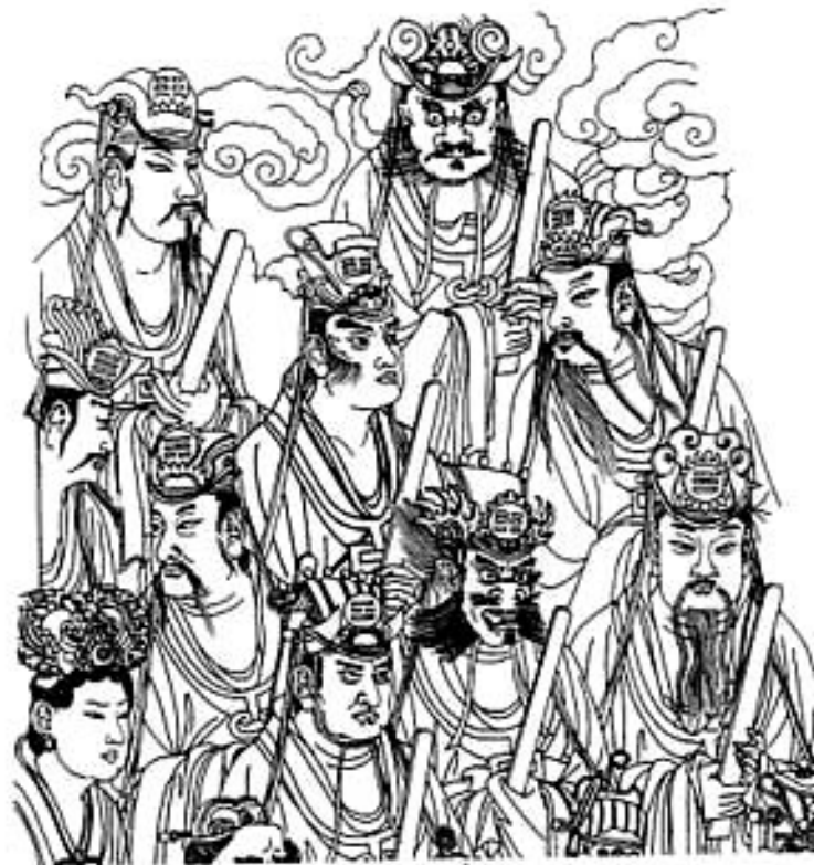
Восемь первичных божеств (huzhaoben), характеризующих три светила (sanguang) — Солнце, Луну и Созвездия, и пять звезд (wuxing) — Меркурий, Марс, Венера, Юпитер и Сатурн.

Далее располагаются пять планет — Венера (Jinying), Юпитер (Muxing), Меркурий (Shuixing), Сатурн (Tuxing), Марс (Huoxing). Также здесь представлены Бог Солнца (Taiyangshen), Бог Луны (Yueliangshan) и двадцать восемь созвездий.